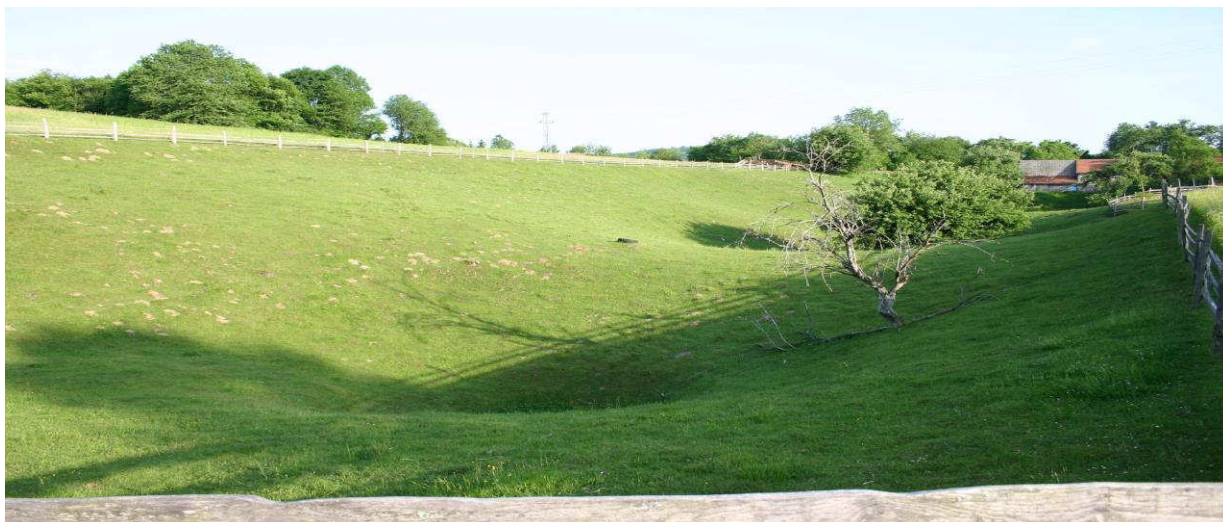
Slika 2. Žumberački mozaični krajobraz

„Poučna staza Parka prirode na Budinjaku veliki je pomak u prezentaciji kulturne baštine.“ (arheolog, Profesor, 2009.)